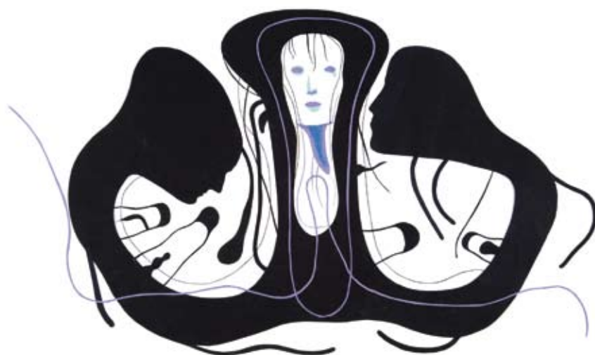
Trindade , 2011, colagem, 25 x 42,5 cm