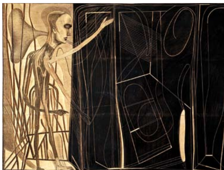
Cubo , 2009, desenho e gravação sobre madeira, 45 x 62 x 2 cm

MATRIZES • XILOGRAVURAS • COLAGENS • DESENHOS