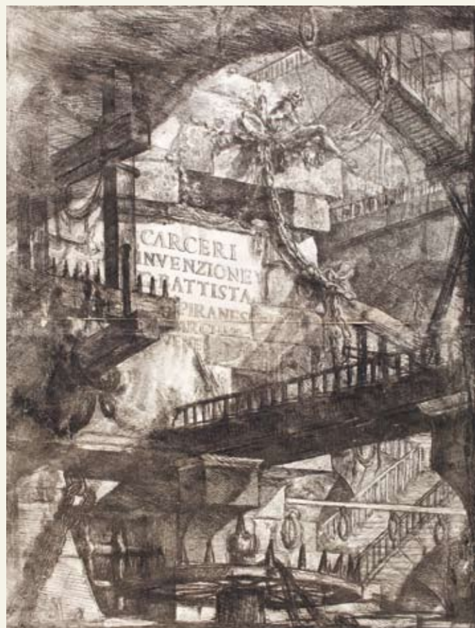
GIOVANNI BATTISTA PIRANESI Le carcere d'invenzione , 1750–3 [fronstispicio | frontispiece] água-forte | etching, 72,8 x 53 cm REAL BIBLIOTECA

Mestres da Gravura é uma coedição da Artepadilla, responsável por sua coordenação editorial, da Caramurê Publicações e da Fundação Biblioteca Nacional, tendo sido patrocinado pela Global Participações em Energia – GPE e pela Companhia Energética Potiguar – CEP, através da Lei Rouanet/Lei de Incentivo à Cultura do Ministério da Cultura.