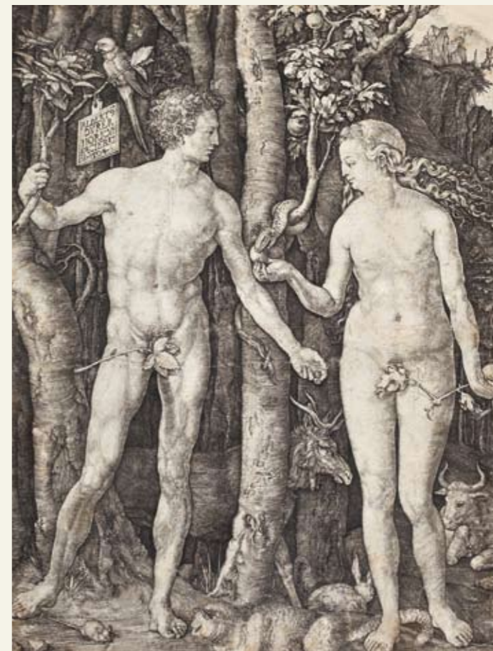
ALBRECHT DÜRER Adão e Eva , 1504 buril | line engraving, 25 x 10,2 cm REAL BIBLIOTECA

Faz parte de projeto da Artepadilla com a Fundação Biblioteca Nacional, o qual inclui a exposição itinerante homônima, com curadoria de Fernanda Terra, apresentada no Centro Cultural Correios Rio de Janeiro em 2011, e no Museu Nacional dos Correios, em Brasília, em 2012, com patrocínio dos Correios. Estão programadas novas apresentações em 2014 no Palácio das Artes/Fundação Clovis Salgado, em Belo Horizonte, e no Museu de Arte da Bahia, em Salvador, com patrocínio da Petrobras.